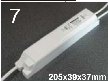
Gehäusefarbe: weiß Abmessungen in Millimeter