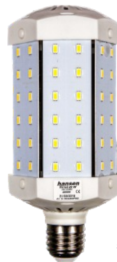
hansen SIRIUS 20W

Bestehende Zündgeräte müssen vor der Installation aus dem Stromkreis entfernt werden.