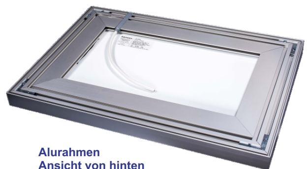
Alurahmen Ansicht von hinten

HINWEIS zum Motiv: Wir empfehlen ausschließlich matte Backlit-Folien, die mit einem digitalen Direktdruck bedruckt werden. Der Druck und die Folie sind nicht im Lieferumfang enthalten und sind auch nicht über uns zu beziehen.