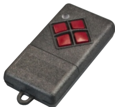
Handsender Reichweite: 20....50 m