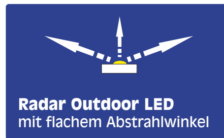
Radar Outdoor LED mit flachem Abstrahlwinkel

Mit der hansen Radar Outdoor müssen weniger LEDs pro Flächeneinheit vorgesehen werden, es wird kostengünstiger und der Montageaufwand geringer.