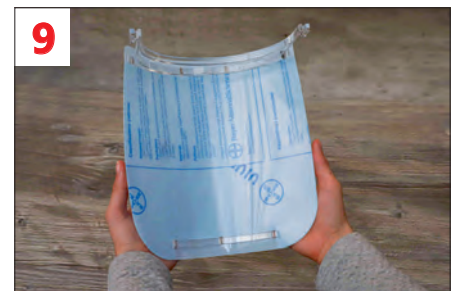
9. Den unteren Halter auf gleiche Art am Visier befestigen