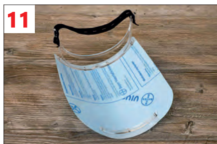
11. Das Knopfloch - Gummiband je nach Kopfgröße auf der anderen Seite einfädeln