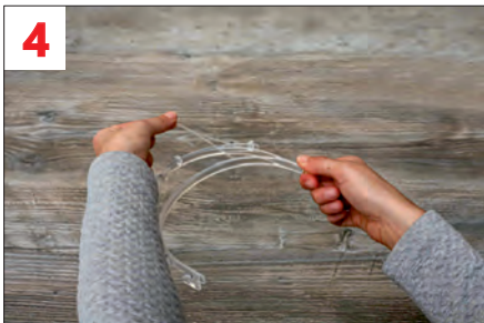
4. Schutzfolie vom oberen Halter abziehen (auf beiden Seiten)