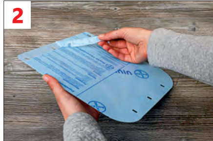
2. Schutzfolie abziehen: - im Bereich des oberen Halters