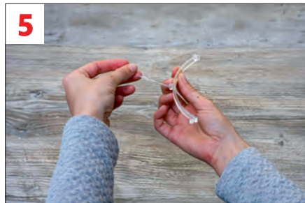
5. Schutzfolie vom unteren Halter abziehen (auf beiden Seiten)