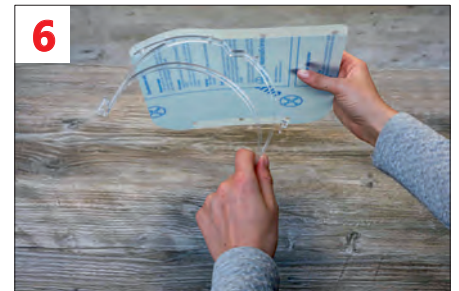
6. Visier am oberen Halter montieren (von links beginnen, siehe Bild)