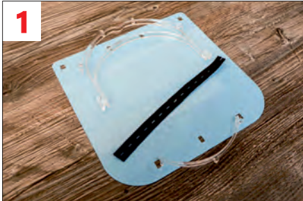
1. Bestandteile der Lieferung: Visier, oberer Halter, unterer Halter, Gummiband