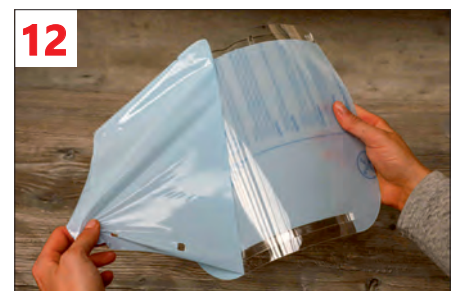
12. Erst vor dem Gebrauch: Schutzfolien von beiden Seiten entfernen