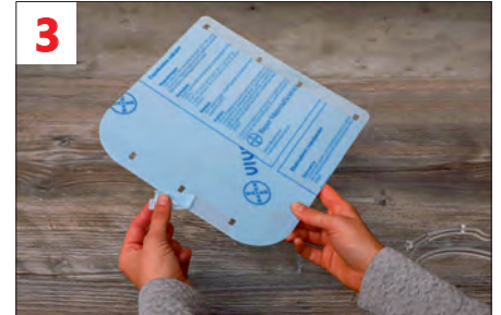
3. Schutzfolie abziehen: - im Bereich des unteren Halters