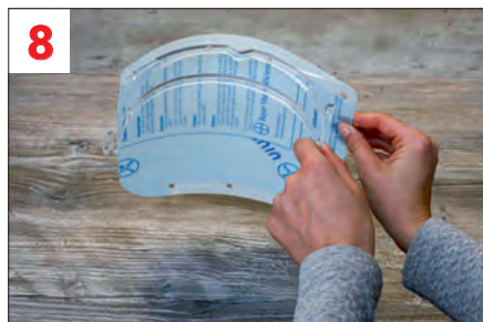
8. Das Visier in die restlichen drei Halter drücken