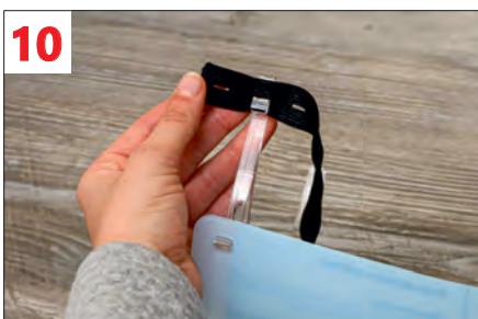
10. Das Knopfloch - Gummiband auf einer Seite am oberen Visier einfädeln